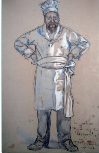
Pierre-Eugène Vibert, «A Julius, maître-coq du Léopard» (mine de plomb, aquarelle et gouache sur papier), 1920, Archives municipales de Carouge