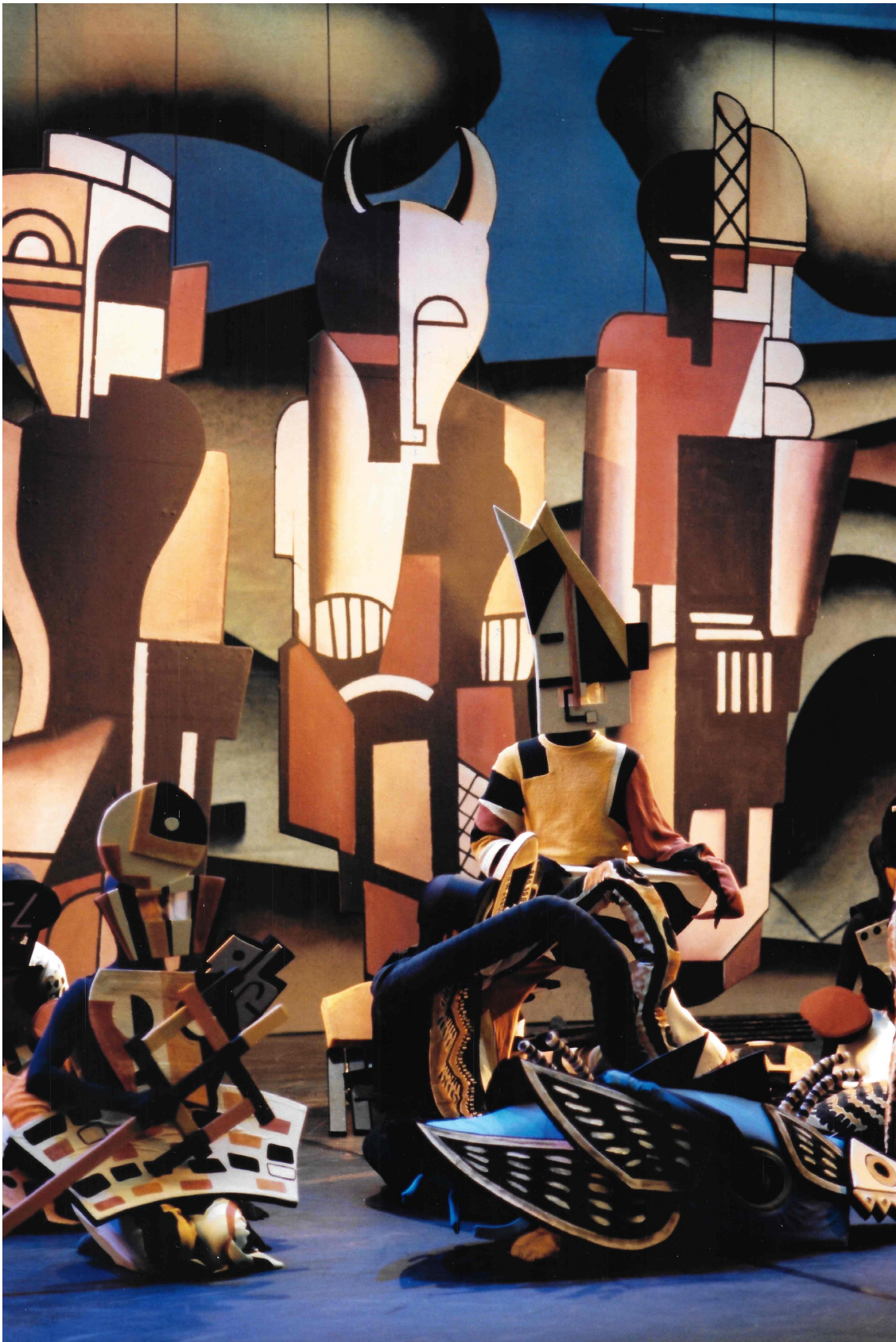
Ballet of the Grand Théâtre de Geneve stage from 2000.