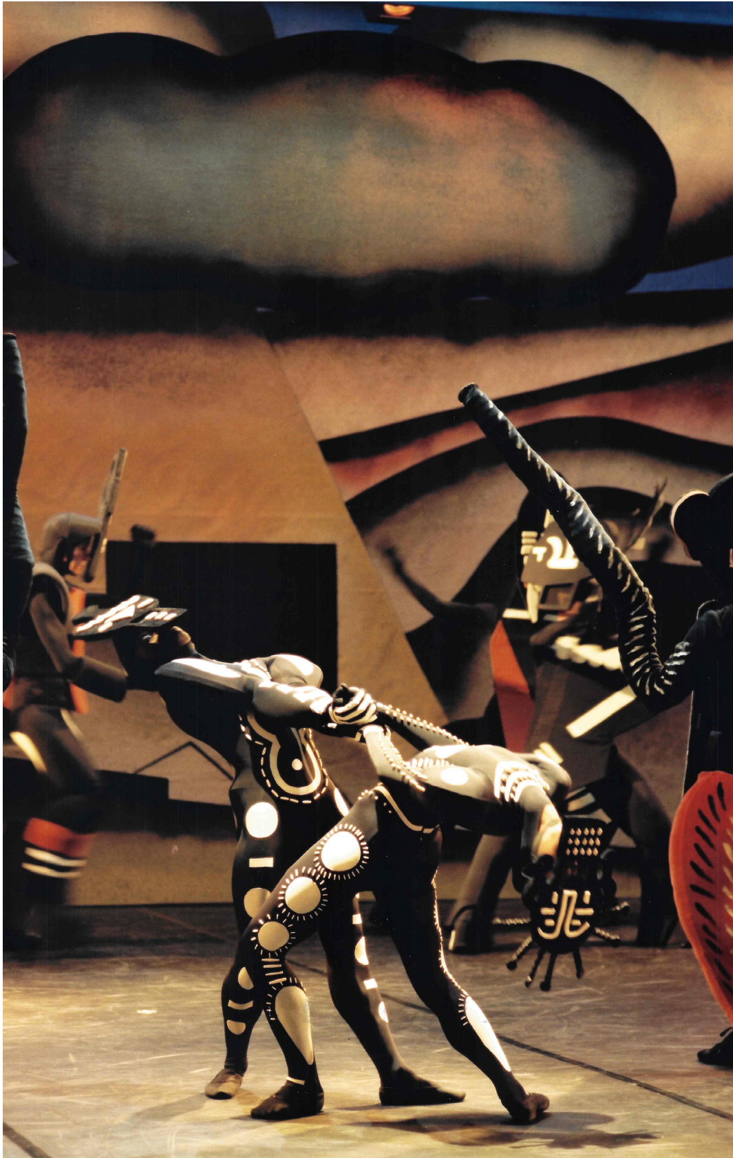
Ballet of the Grand Théâtre de Geneve stage from 2000.