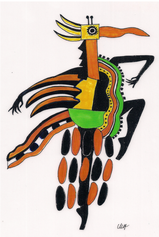
© Millicent Hodson's Birds in motion

Οι Μίλλισεντ Χόντσον και Κέννεθ Άρτσερ παρουσιάσανε δύο αναβιώσεις του μπαλέτου μετά την πρεμιέρα του έτους 2000 στη Γενεύη. Η πρώτη πρόταση τους έγινε με το Maggiodanza του Γεωργίου Μαντσίνι (Giorgio Mancini) στη Φλωρεντία το 2003, ενώ η δεύτερη παρουσιάστηκε με τους χορευτές του Μπαλέτου της Λωραίνης, στο Νανσί, με τον Πετερ Ζάκομπσον (Petter Jacobsson), το 2012. Το ανασχηματισμένο μπαλέτο αποτέλεσε κεντρικό στοιχείο του σύγχρονου έργου του Faustin Linyakula.