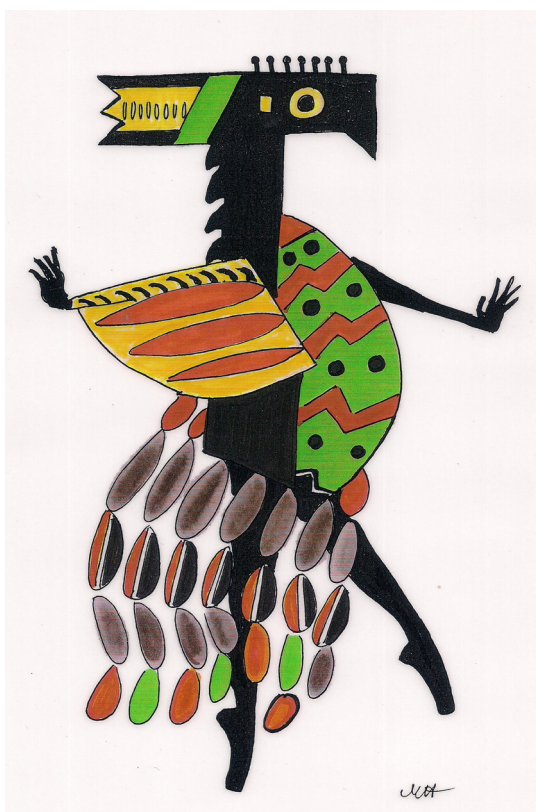
© Millicent Hodson's Birds in motion

Κοστούμια και Ντεκόρ του Κέννεθ Άρτσερ βασισμένα στα σχέδια του Φερνάν Λεζέ.