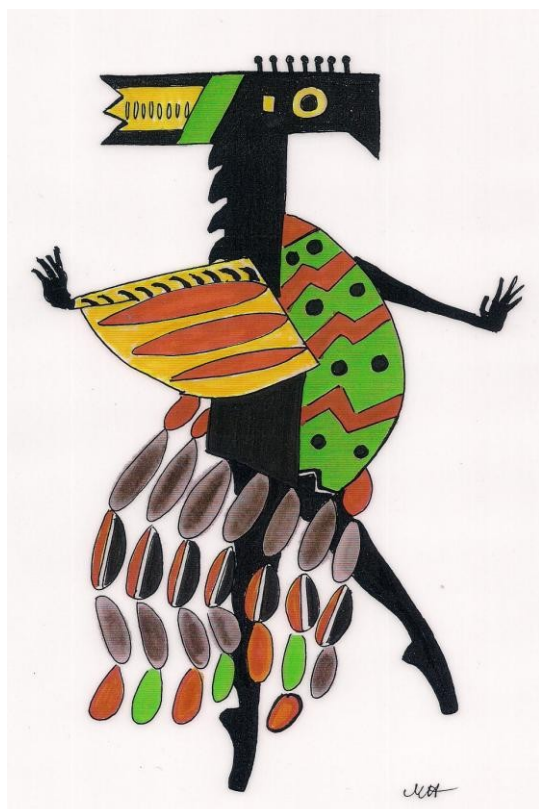
© Oiseaux en mouvement de Millicent Hodson

Chorégraphie de Millicent Hodson reconstituée d'après Jean Börlin. Costumes et décors de Kenneth Archer reconstitués d'après Fernand Léger