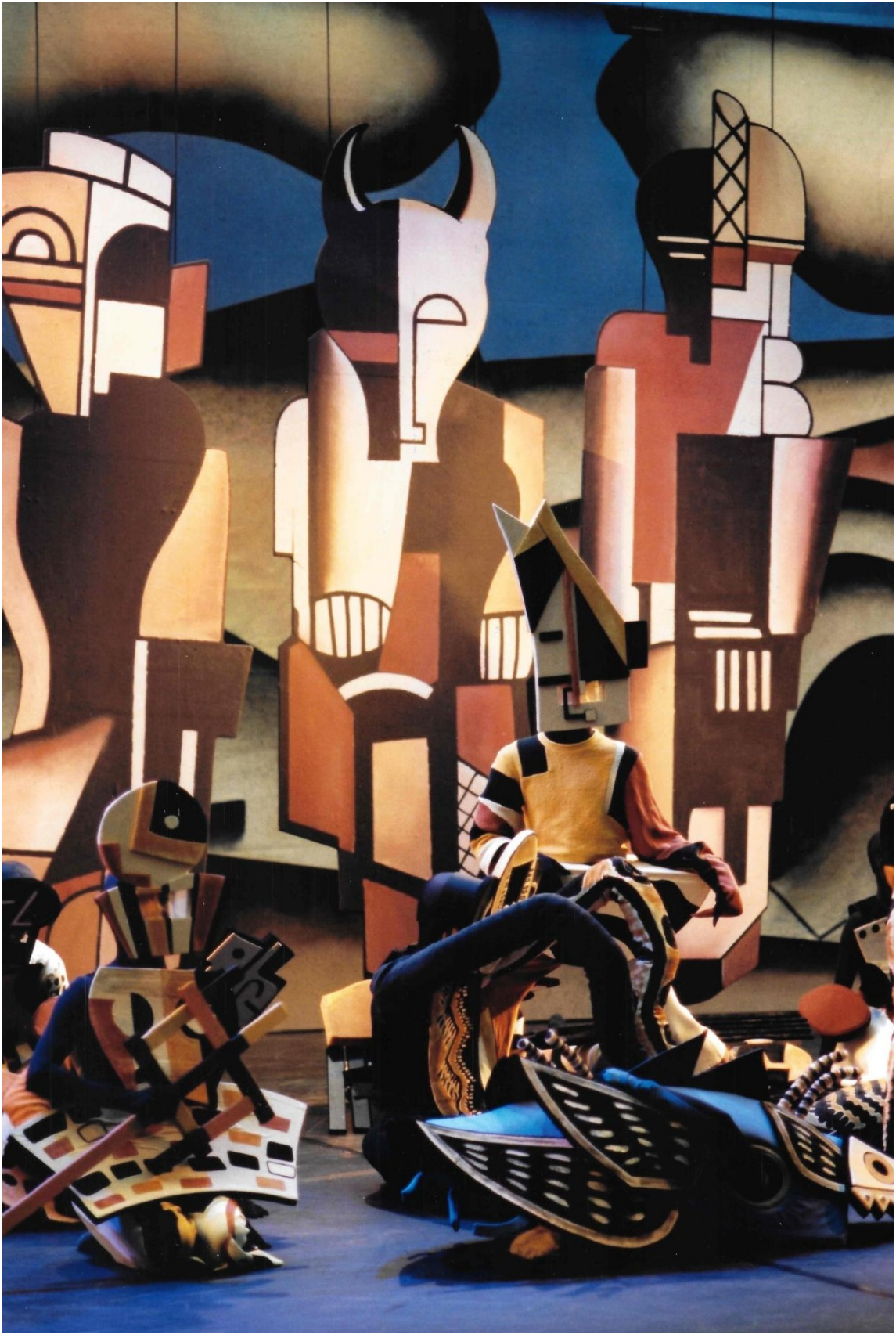
Ballet du Grand Théâtre de Genève en 2000.