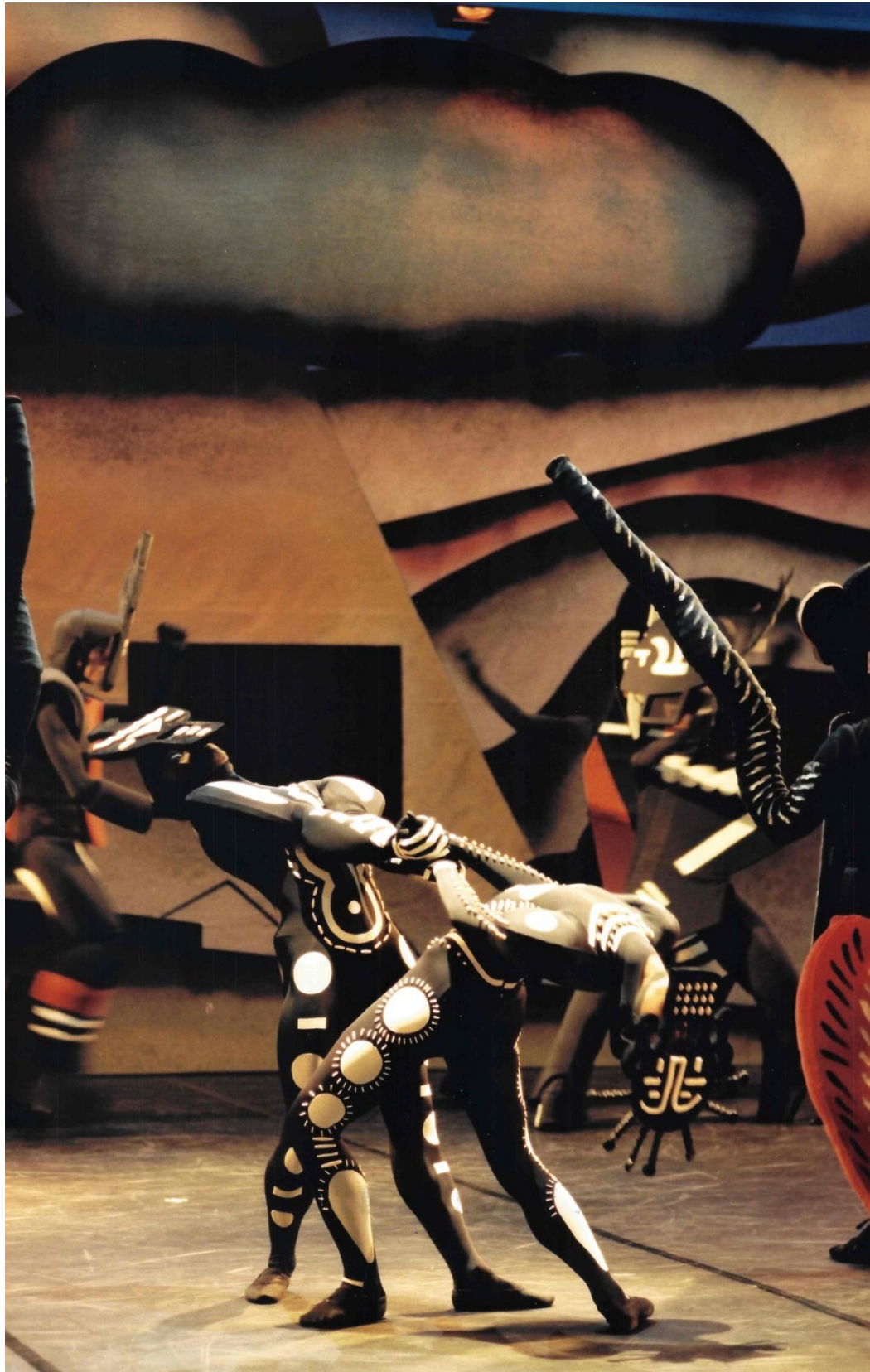
Ballet du Grand Théâtre de Genève en 2000. © Nicholas Lieber.