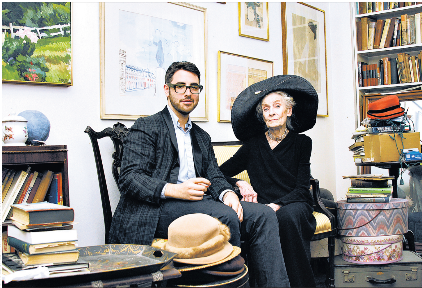
Le photographe Ari Seth Cohen avec l'un de ses modèles. Ce qu'Ari raconte aujourd'hui dans son blog, ce sont bien sûr des histoires de style. Des armoires comme autant de fenêtres ouvertes sur le passé, une histoire de la mode illustrée. ARCHIVES

C'est justement en ouvrant en 2008 Advanced Style, un blog de looks de rue consacré aux seniors, et en particulier aux femmes, qu'Ari Seth Cohen a bâti son succès. Le trentenaire a aujourd'hui quitté son job de libraire et sillonne le monde pour faire la promotion de son travail – des expos, un livre publié ces jours-ci et un film qui devrait voir le jour à la rentrée. Lorsqu'il débute, les blogs de streetstyle sont en plein essor et les objectifs se tournent davantage vers ce que portent les rédactrices aux abords des shows que vers ce qui défile sur les podiums. C'est l'avènement d'un regard sur la mode plus intimiste, un déplacement de la scène aux coulisses, et l'émergence de ces blogs « aspirationnels », dont les modèles, des inconnus pris dans la rue, donnent corps aux fantasmes d'une époque bien mieux que des images de papier glacé. Reste la jeunesse, omniprésente. Lorsque Ari Seth Cohen débarque à New York de sa Californie natale sur les conseils de sa grand-mère adorée, il n'a d'yeux que pour les 70 ans et plus. Pour cette élégance d'un autre temps – discrète ou excentrique, corsetée